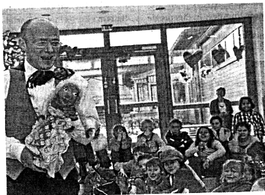
Die temporeiche, englische Inszenierung verband in der Marienschule Figurenspiel und Livemusik.